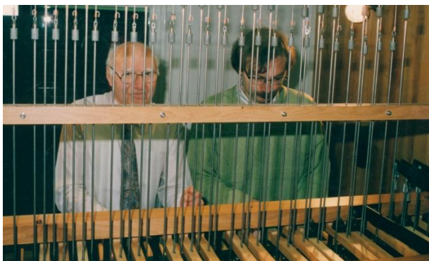
Opvolgingsconcert in 1991

Om 16 u: Academische zitting waarbij we 70 jaar beiaardconcerten in Mol belichten, feestelijk afgesloten met een receptie voor ingeschrevenen.